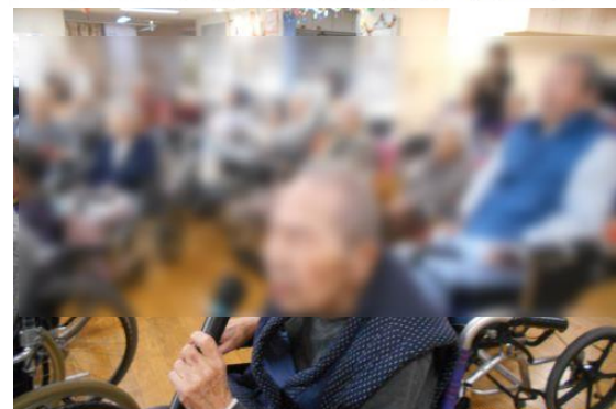
得意の「兄弟舟」を披露！