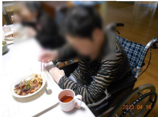
美味しく出来上がりました