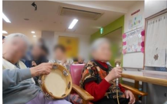
少し緊張気味です