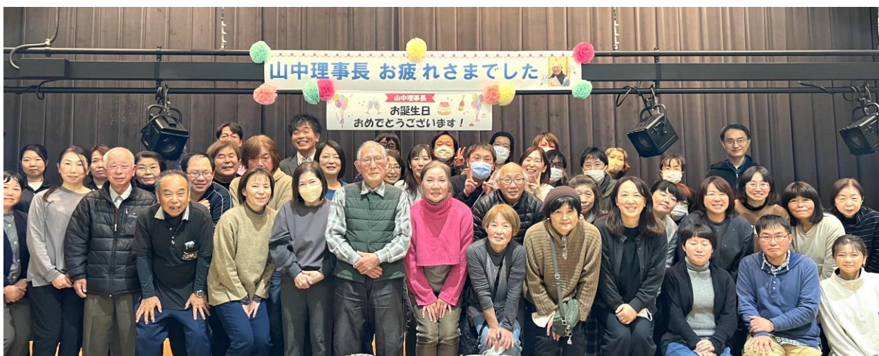
職員一同で、前理事長の長年の功績を労いました