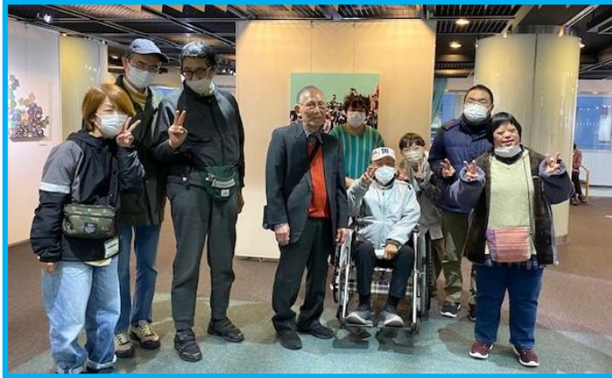
西淡路希望の家の皆さんと山中理事長（当時）