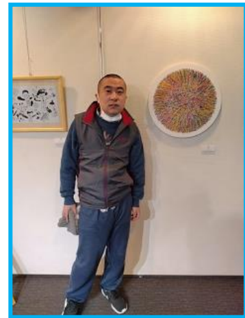
夫々の作者が作品と記念撮影